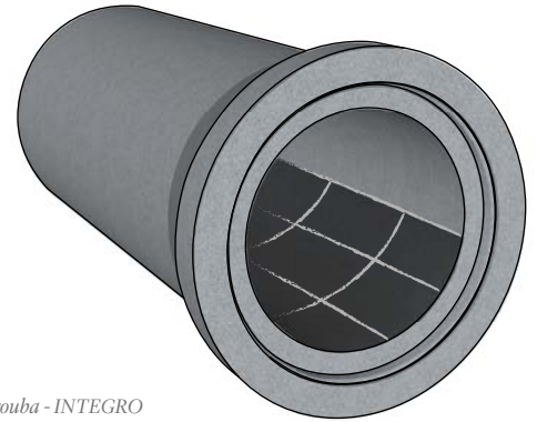
Kruhová trouba - INTEGRO

Armatura je navržena dle platných norem - Eurokódů. Kruhové trouby s čedičovým obkladem jsou obchodním zbožím.